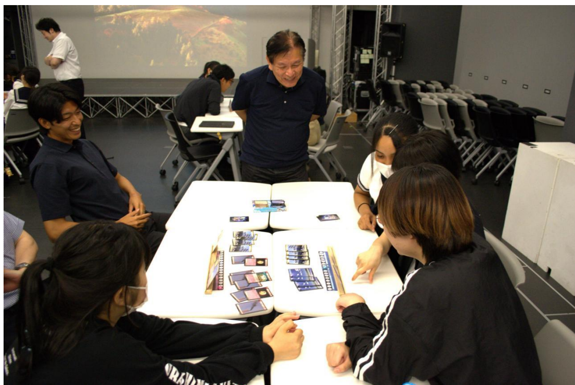
※プロジェクト参加者によるマイアース体験会を行った時の様子

本プロジェクトは、NPO法人 SoELa が展開している対戦型トレーディングカードゲーム「マイアース」をベースに、新宿区の自然環境や地域性を反映したオリジナル版の制作に挑むものです。